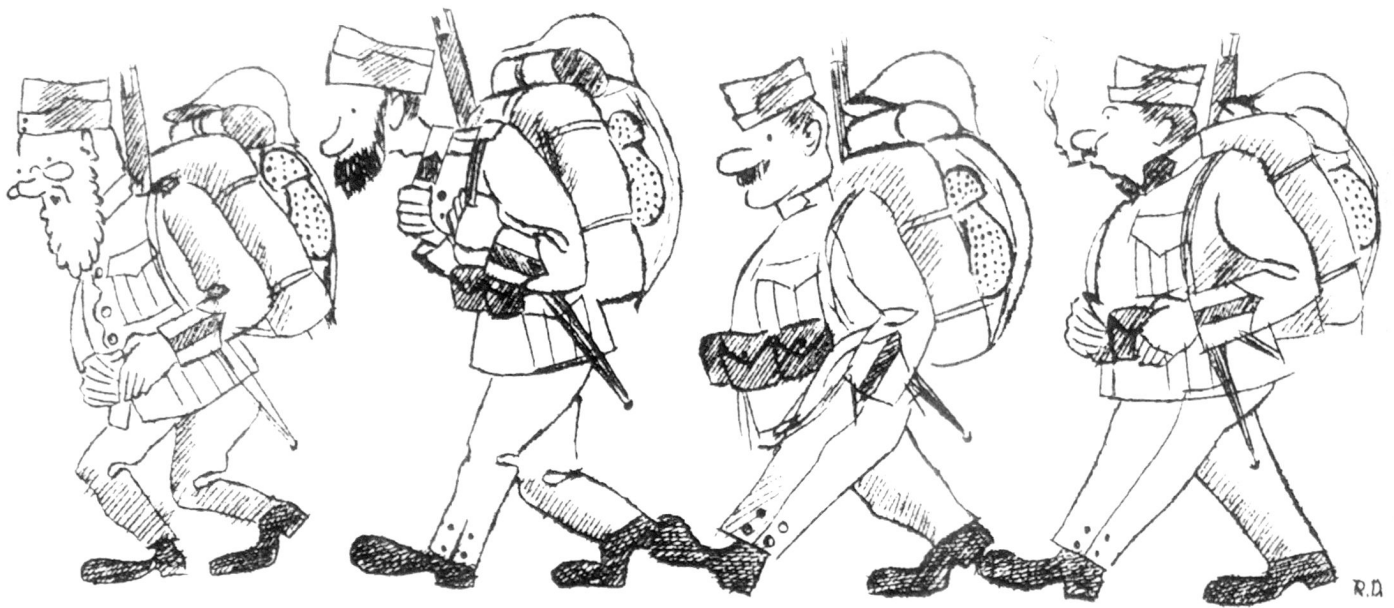
Les bataillons frontière de fusiliers comprennent des hommes des classe d'âge de l'élite, de la landwehr et du landsturm (caricature parue dans Le Sac à pain , printemps 1940)

mitrailleurs. Directement subordonnées au commandant de bataillon, des sections de canons antichars et de lance-mines.