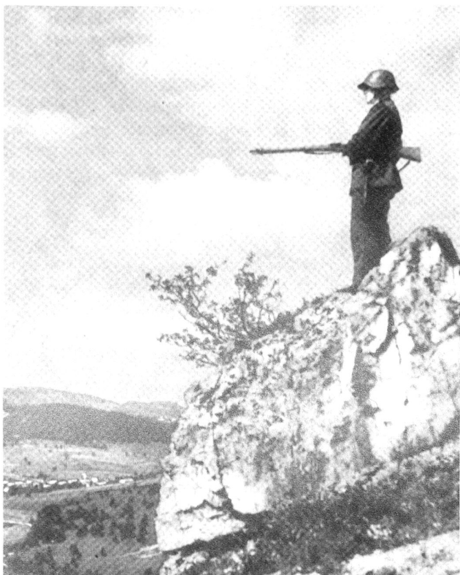
Un document iconographique mythique, la sentinelle des Sommètres près du Noirmont dans le secteur de la brigade frontière 2.

D'emblée, le service des troupes frontières s'avère ennuyeux et monotone; la garde, des travaux de renforcement du terrain, une instruction pas toujours adaptée, le sentiment que le travail attend à la maison contribuent à miner le moral. Ces activités rythment la vie des hommes qui font toujours service au même endroit : ils veillent et ils creusent, ils font les terrassiers et préparent des positions, ils transportent du sable, du gravier, du ciment. Les officiers insistent peu sur l'instruction, d'autant plus que les stocks de munitions sont au plus bas et que les fabrications restent inférieures aux besoins. L'Etat-major